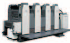
RMGT 520GXモデル 菊四裁寸延びオフセット印刷機