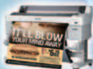
プリントサービス