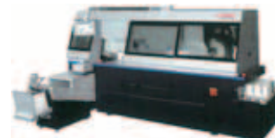
Horizon BQ-480 自動無線綴機4クランプタイプ