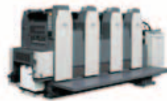
RMGT 520GXモデル 菊四裁寸延びオフセット印刷機