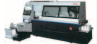
Horizon BQ-480 自動無線綴機4クランプタイプ