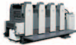
RMGT 520GXモデル 菊四裁寸延びオフセット印刷機