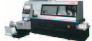
Horizon BQ-480 自動無線綴機4クランプタイプ