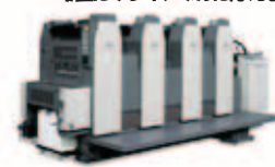
RMGT 520GXモデル 菊四裁寸延びオフセット印刷機