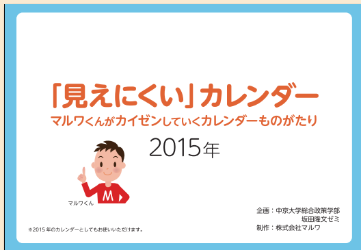
第8回メディア・ユニバーサルデザインコンペティション 一般の部 経済産業大臣賞 見えにくいカレンダー (株式会社マルワ / 瀬瀬 伸太郎)