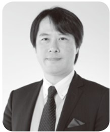
北海道印刷工業組合 札幌支部 支部長