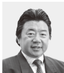
島村全印工連会長