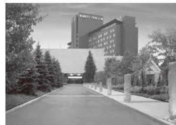
札幌パークホテル