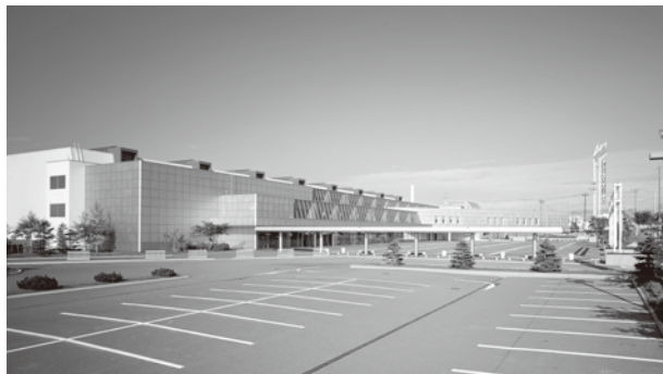
アクセスサッポロ